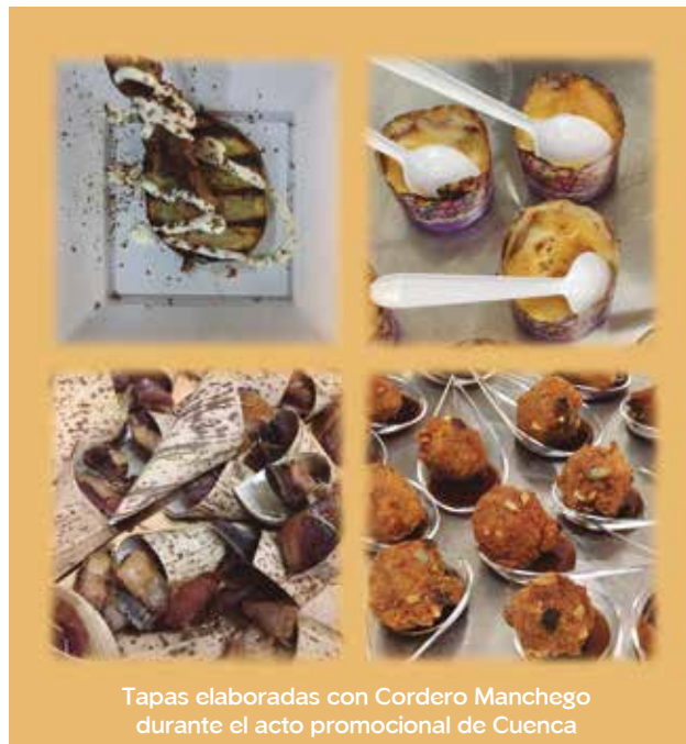
Tapas elaboradas con Cordero Manchego durante el acto promocional de Cuenca