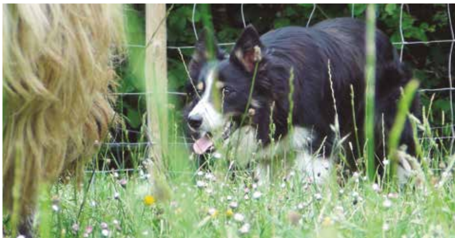
Primer plano de Border Collie.

No existe una raza de perros de pastor ni un individuo que, a priori, se adecúe o adapte, 100%, a tu día a día. Y, mucho menos, sin esfuerzo. Más bien, eres tú quien debes aprender a utilizar ese ejemplar de esa raza concreta que, con sus limitaciones, te va a ayudar, con seguridad, en tu trabajo diario. Si te haces con una genética “decente”, aprendes un sistema de trabajo, cuidas las condiciones y le das tiempo a crecer (en todos los sentidos), tendrás siem-