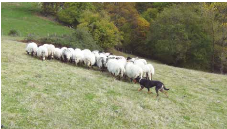
Kelpie Australiano empujando un rebaño de Latxas.

leccionar unas aptitudes favorables al trabajo con los animales más usuales en granjas.