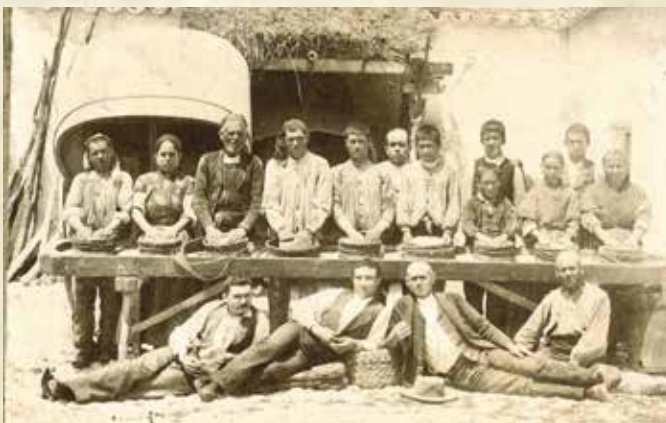
Figura 1. Finca Los Arenales finales del siglo XIX. Sin duda la ocasión animó a grandes y pequeños, mujeres y hombres. Resalta la indumentaria más rica del mayoral y mayordomo, terceros por la izquierda de la fila superior e inferior.

En época más recientes, primer tercio del siglo XX hay diversas referencias de solicitud de permisos para la venta e incluso exportación de queso en la localidad de Herencia, lo que da idea del nivel del sector transformador y comercial. Estas iniciativas contaron con el apoyo técnico de un ilustre herenciano, D. Calixto Moraleda, promotor de la Estación Pecuaria de Ciudad Real a partir de la cual desarrolló una imponente labor que incluyó la formación del actual Rebaño Nacional (por supuesto con animales de origen herenciano), la creación de la "Escuela de Queseros Artesanos" y numerosos estudios y cursos dirigidos a ganaderos y queseros. Podemos hacernos una idea de la forma de trabajar en los