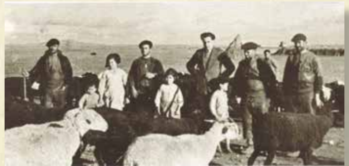
Figura 2. Pastoreo en la Vega de Don Vicente. Destacamos la presencia de ovejas negras y la silueta del chozo.

En esta comarca tan cervantina, la explotación de la oveja se remonta a tiempos inmemoriales. Tras la Reconquista se afianzaría la ganadería en la zona, siendo de gran interés para