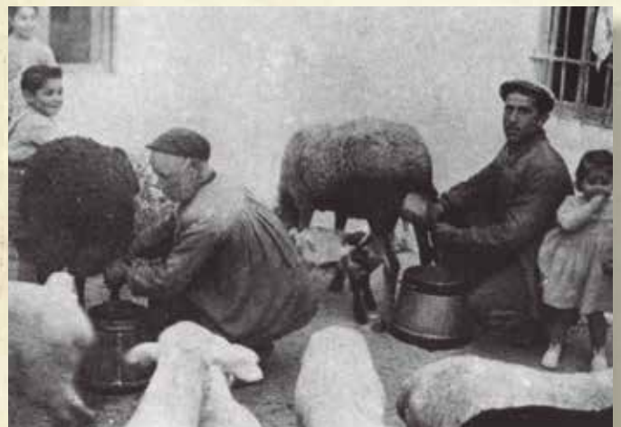
Figura 3. Ordeño manual. Obsérvese la presencia de corderos, las blusas y la postura para realizar la faena.