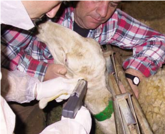
El implante se coloca en la base de la oreja del animal, como puede verse en la imagen, para lo que se requiere pocos segundos.

mentando con su uso un 13% el número de animales en ordeño (Ramirez, J.C y co. SEOC 2004) y un 34% la venta de corderos (Ramirez, J.C. y col, SEOC 2004, Pontes y col. SEOC 2003. Pontes y col SEOC 2004), coincidiendo resultados con otras razas españolas que marcan mejoras en las fertilidades de primavera.