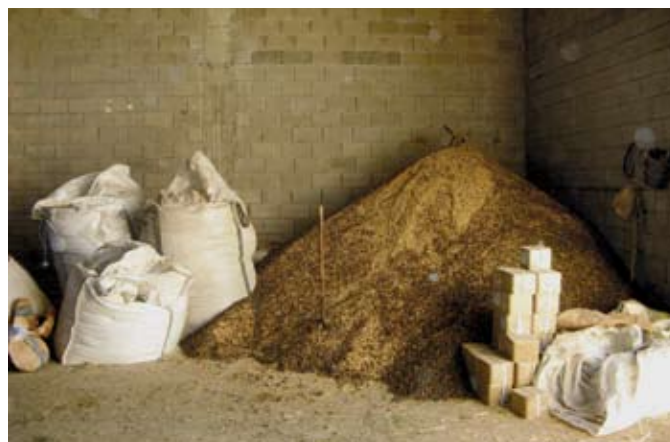
Una buena alimentación es aquella que favorece el aumento de la producción manteniendo la salud de las ovejas, la calidad de la leche y la rentabilidad de la explotación.

En conclusión , con una oveja buena existe un diferencial en los ingresos de 42 € (7000 ptas.) /lactación, respecto a una normal , lo que supone que en una explotación de 1.000