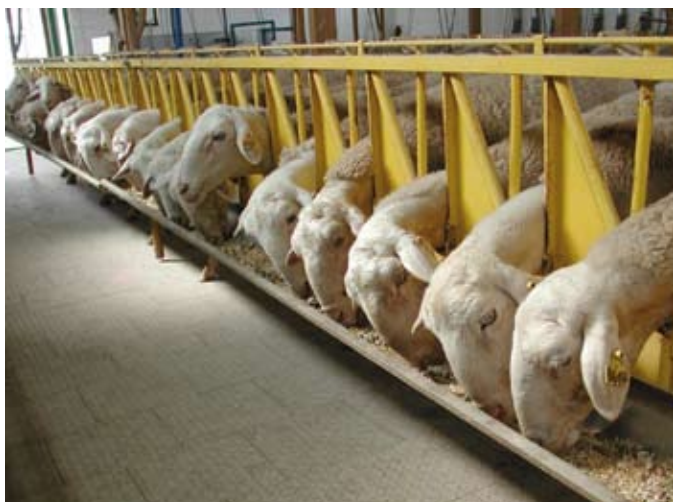
Una oveja con una buena producción de leche, nos devolverá con creces la inversión que hagamos en alimentación.

de un solo forraje, de tal forma que hasta al mejor veterinario le resulte un puzzle de patologías difíciles de resolver.